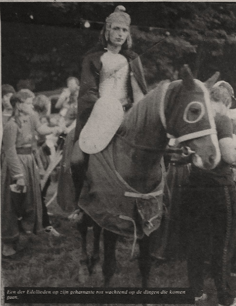
Een der Edellieden op zijn geharnaste ros wachtend op de dingen die komen gaan.

Zaterdagmiddag om 15.00 uur zullen de ridders elkaar in de op historische leest geschoelde zeskamp bestrijden. Deze zeskamp zal door de alom bekende zeskampcoach van de TV Dick Passchier geleid worden, welke ongetwijfeld de spelers tot maximale prestaties zal weten te praten. Aan deze zeskamp zal door ruim 90 ridders en middeleeuwse bewoners worden deelgenomen. De zes groepen welke dit jaar aan de spelen deelnemen, zijn gevormd uit gasten van camping Roland, camping Hengeland, camping Bos en Heide, voetbal