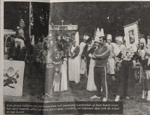
Een groep ridders en jonkvrouwen met spanning wachtend op hun beurt voor het met waerheit af te spelen zeskamp, en waaraan dan ook de jokers te part komen.

jaar weer op een massale opkomst. De laatste weken hebben zij meer dan honderd vrijwilligers aan het werk bij het maken van het kasteeldecor, het aanleggen van een bad waarboven zich de gebruikelijke waterpartijen zullen afspeelen, drinkwatervoorziening, sanitair, telefoon, enz. V.V.V. Afferden heet iedere lezer dan ook van harte welkom, op deze voor een dorp niet voor mogelijk gehouden feesten.