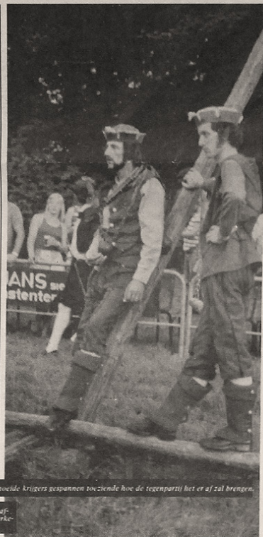
Vermoede krijgers gespannen toezien hoe de tegenpartij het er af zal brengen.