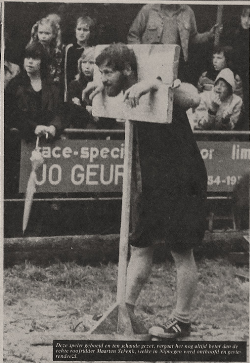
Deze speler gehooid en ten schande gezet, vergaet het nog altijd beter dan de echte roofridder Maarten Schenk, welke in Nijmegen werd onthoofd en gericrendeed.

Het is dan ook echt een aansporing waard, voor bewoners van de omliggende plaatsen om aanstaande zondag eens op het kasteel Bleyenbeek zijn zondagsplicht te komen vervullen. Deze serieuze plechtigheid wordt gevolgd door een vrolijke noot, want hierna vinden in de feesttent de Frúschoppen plaats, welke muzikaal worden verzorgd door de Mullenbeker muzikanten uit Wansum en de Eckelse muzikanten uit Afferden. Deze tot 15.00 uur durende Frúschoppen behoeven nauwelijks aanbeveling gezien de geweldige belangstelling in de voorgaande jaren. Zondagavond is de finale van de feesten in de vorm van het traditionele roofridderbal met attracties. Dat het er warm toe zal gaan zegt de naam van het muziekgezelschap al, n.l. de George Baker Selection. De organisatoren welke bijna een jaar van voorbereiding achter de rug hebben, om alles in kunnen en kruiken te krijgen, rekenen ook dit