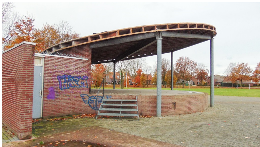
Kiosk in het park.

Het park wordt door verschillende personen genoemd als kwetsbare plek. Met name de muziekkiosk wordt gezien als een probleemplek waar veel vandalisme plaatsvindt. Ook de paden in het park zijn slecht en iemand geeft aan dat in de speeltuin glas ligt.